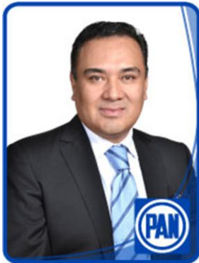
Dip. Ulises Ramírez Núñez.

POSICIONAMIENTO QUE HACE EL DIPUTADO ULISES RAMÍREZ NÚÑEZ, A NOMBRE DEL GRUPO PARLAMENTARIO DEL PARTIDO ACCIÓN NACIONAL, CON MOTIVO DE LA APERTURA DEL PRIMER PERIODO ORDINARIO DE SESIONES.