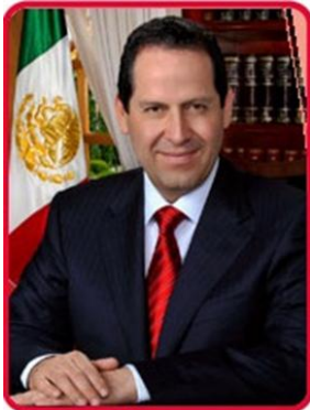
Dr. Eruviel Ávila Villegas.