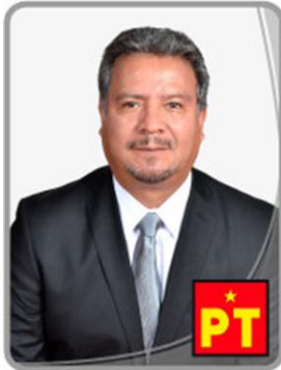
Dip. Norberto Morales Poblete.

POSICIONAMIENTO QUE HACE EL DIPUTADO NORBERTO MORALES POBLETE, A NOMBRE DEL GRUPO PARLAMENTARIO DEL PARTIDO DEL TRABAJO, CON MOTIVO DE LA APERTURA DEL PRIMER PERIODO ORDINARIO DE SESIONES.